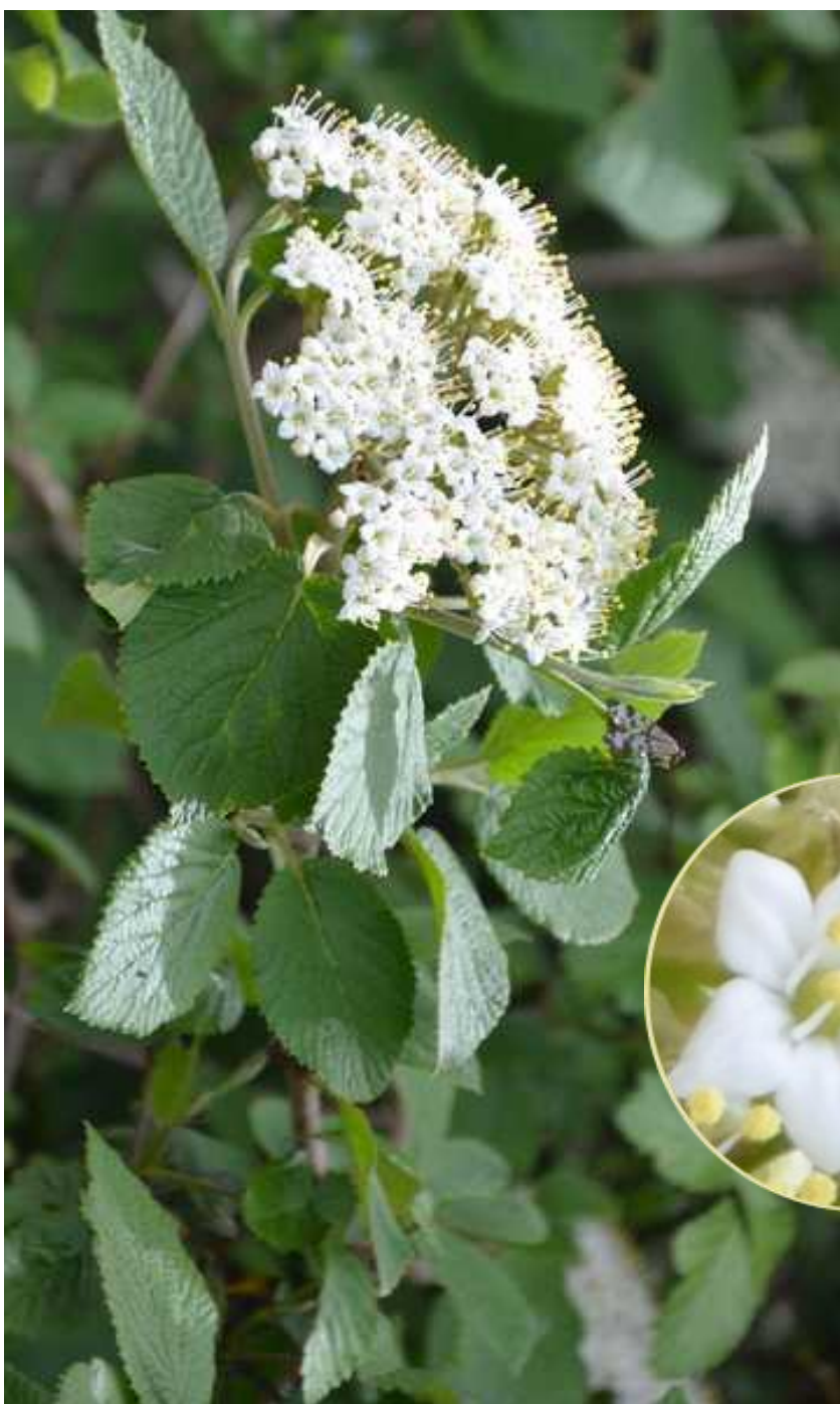
Lantanier Lantana camara Famille des Verbénacées