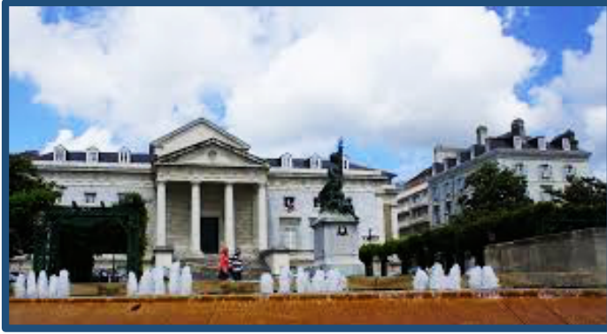
Place de la Libération